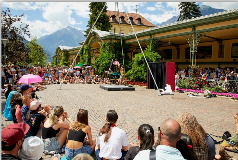
Auftritt der Jugendlichen beim Straßenkünstlerfestival Asfaltart 2023

Drei Studierende der Fakultät der Bildungswissenschaften der Freien Universität Bozen haben im Studienjahr 2022/2023 im Rahmen ihrer Ausbildung eine achtsündige Hospitation beim Zirkusverein durchgeführt. Die Zusammenarbeit mit den Bildungswissenschaften besteht seit mehreren Jahren und erfährt positive Rückmeldungen: Den Studierenden wird dabei bei einem Einführungsgespräch ein Einblick in die Leitideen des Vereins und der Zirkuspädagogik vermittelt, anschließend lernen sie die verschiedenen Angebote des Vereins, von der Bewegungswerkstatt für Kinder im Alter von 5 – 6 Jahren über die Zirkuskurse für Kinder und Jugendliche, bis hin zum Einrad-Angebot des Vereins kennen.