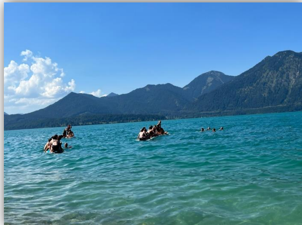
Sommer 2023: vielseitig und spannend