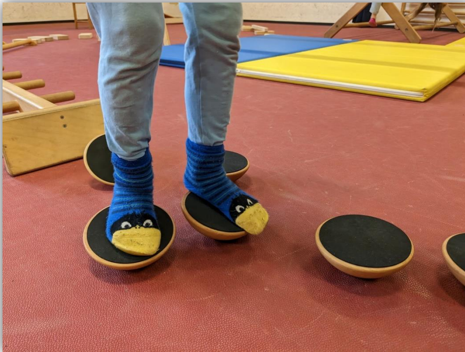
Balancierübungen im Rahmen der Bewegungswerkstatt

Nach dreijähriger, pandemiebedingter Unterbrechung hat sich Animativa sehr über die Anfrage der Bezirksgemeinschaft Burggrafenamt und des Pastor Angelicus Meran gefreut, die wöchentliche Zusammenarbeit mit zwei Gruppen am Pastor Angelicus im Herbst 2023 wieder aufzunehmen. Aufgrund der Pandemie war das Projekt im Frühjahr 2020 unterbrochen worden. Letztlich hatten sich, nach Erzählung der Verantwortlichen am Pastor Angelicus, viele der TeilnehmerInnen des Öfteren erkundigt, ob und wann denn die sehr beliebten Zirkusstunden wieder angeboten würden. Die Rückkehr eines Animativa-Teams an das Pastor Angelicus wurde von den Teilnehmern dann entsprechend positiv angenommen. Die Zusammenarbeit mit dem Pastor Angelicus bestand bereits für etwa acht Jahre, bevor diese durch die Pandemie unterbrochen wurde.