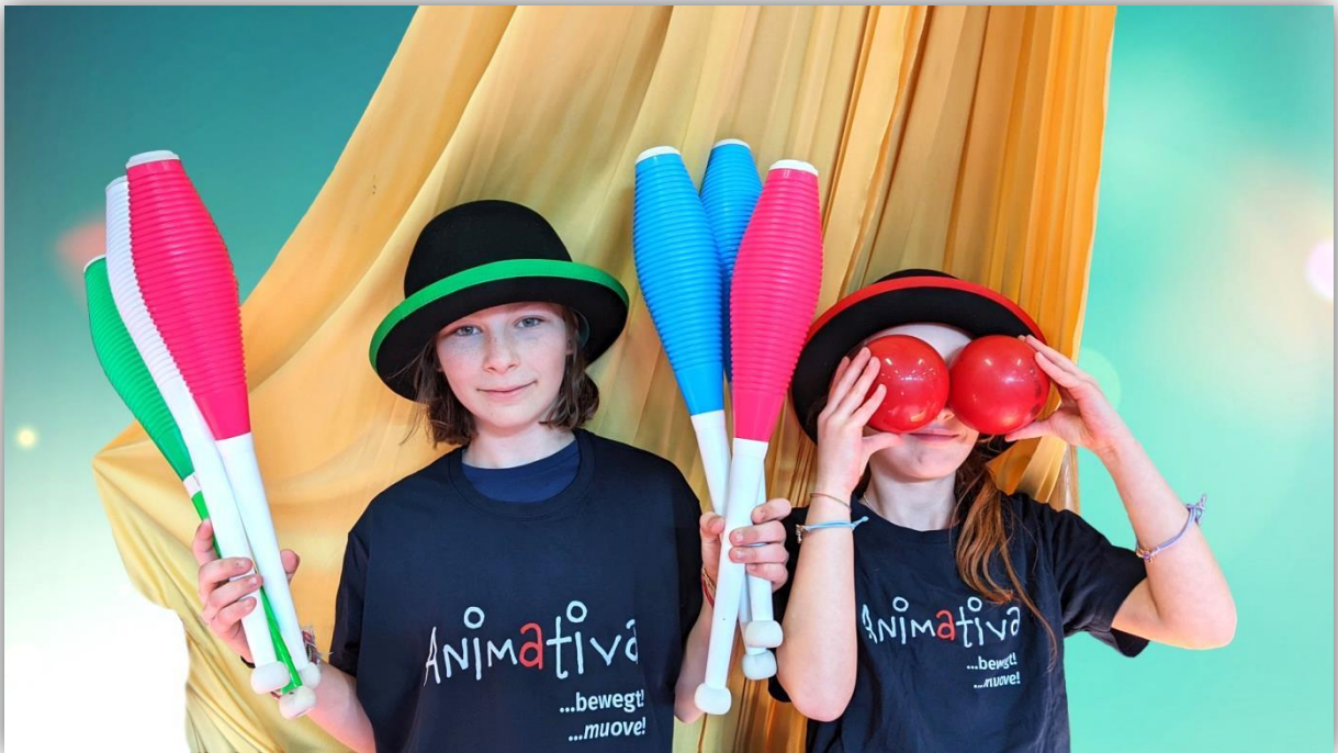
Titelbild eines Kursprogrammes im Jahr 2023

Animativa VFG wurde vor mittlerweile 30 Jahren, am 15. Mai 1993, von Zirkusbegeisterten zur Förderung der Jonglier- und Zirkuskunst gegründet. Zweck des Vereins ist es, die Zirkuskunst als eigenständigen kulturellen Beitrag zu fördern. Animativa leistet einen wichtigen Beitrag in der Bildungs-, Kinder-, Jugend- und Erwachsenenarbeit in Südtirol. Auch die Arbeit mit Menschen mit Beeinträchtigungen und/oder besonderen Bedürfnissen ist dem Verein ein Anliegen. Soziales, Kunst und Kultur verschmelzen im Zirkus in einem. Unsere Zirkusarbeit ist ganzheitliche, nicht leistungsorientierte Bewegungs- und Bildungsarbeit. Unter Ganzheitlichkeit verstehen wir das Lernen und Erforschen mit allen Sinnen, mit unserem Verstand, unseren Emotionen und unserem Körper. Unser Bestreben ist die gemeinsame Gestaltung eines Erfahrungs- und Erlebnisraumes, in dem diese ganzheitliche Entwicklung durch die vielfältigen zirkusischen Disziplinen gefördert werden kann. Zirkusarbeit verkörpert für uns all dies.