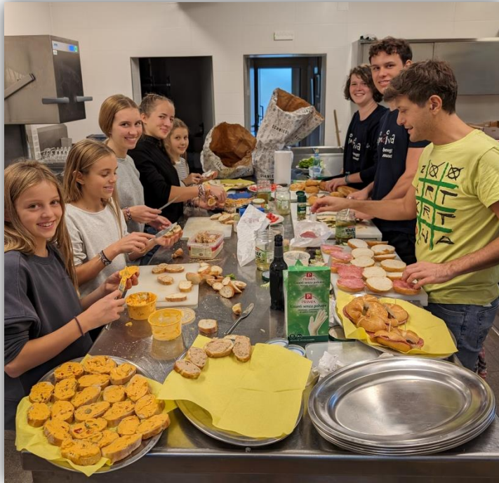
Viele fleißige Hände beim Animativa Gala-Abend

Pamer gesucht, und gebeten, die Wochenstunden der Mitarbeiterin der Buchhaltung im Laufe des Jahres 2023 den Erfordernissen anzupassen.