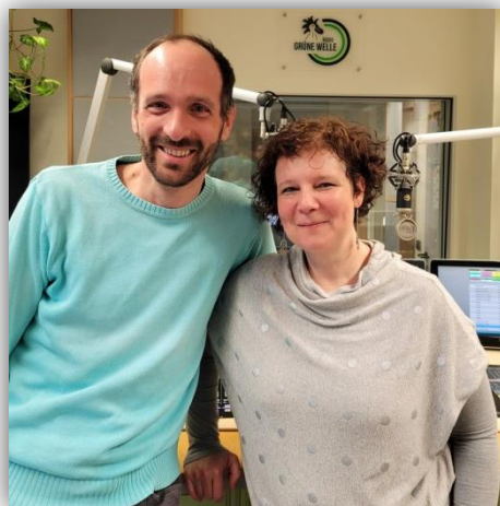
Die Vorsitzenden berichten über Animativa bei Radio Grüne Welle