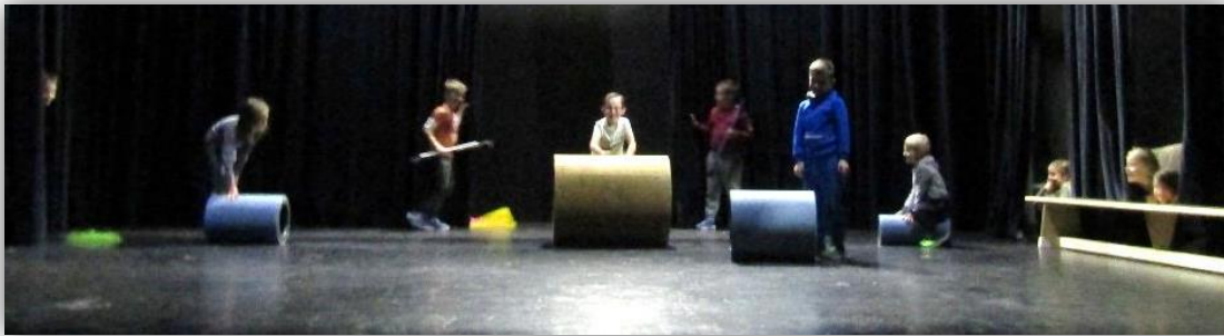
Abschlussaufführung eines Schulprojektes

Bei den Schulprojekten erleben unsere ZirkusbetreuerInnen immer wieder, dass die Lehrkräfte, welche die SchülerInnen eigentlich seit Längerem kennen und begleiten, überrascht sind, welche unentdeckten Fähigkeiten in ihren Zöglingen stecken. Häufig sind es gerade die Kinder, die laut Lehrkräften im Schulalltag negativ auffallen, die beim Zirkusprojekt Feuer und Flamme sind und über sich hinaus wachsen.