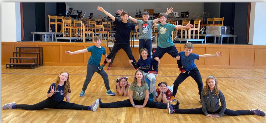
SchülerInnen bei einem Bewegungs- und Zirkusprojekt des Vereins