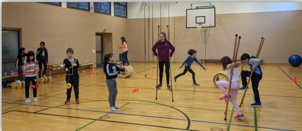
SchülerInnen in Aktion bei den Bewegungs- und Zirkusprojekten

Die Schul- und Kindergartenprojekte sind eine sinnvolle Bereicherung und Stärkung für jede Gemeinschaft: Der Unterricht wird für die Dauer des Projektes in die Turnhalle verlegt und die Kinder können, in einem nicht wettbewerbsorientierten Umfeld, mit den Zirkusbetreuern die Welt der Zirkuskünste erleben und sich selbst und die Gemeinschaft neu erfahren. Im Zirkus tritt der Wettbewerbsgedanke in den Hintergrund. Spiele und Übungen zielen darauf ab, sich selbst und andere wahr- und anzunehmen und tragen so positiv zur Gruppendynamik, zum Gemeinschaftssinn und zum Vertrauen innerhalb der Gruppe bei. Gleichzeitig lernen die Kinder, Ängste und Hemmungen zu überwinden, erkennen aber auch ihre eigenen Grenzen.