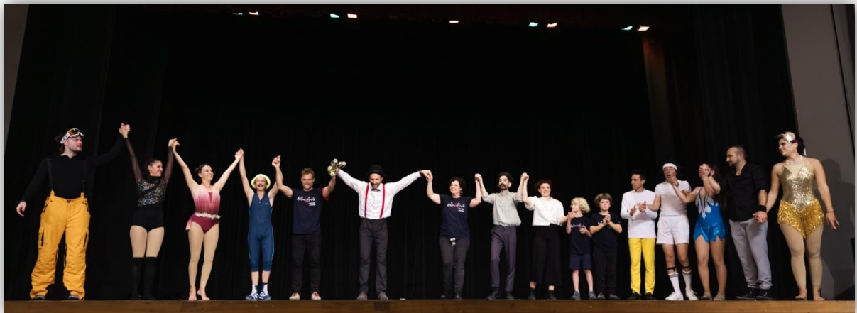
Verbeugung der ArtistInnen am Ende der gelungenen Jubiläumsfeier

"Der Kurs hat meiner Tochter sehr gut gefallen. Seit langem das erste Mal, dass sie dafür abends gern ins Bett und morgens gern aufgestanden ist!"