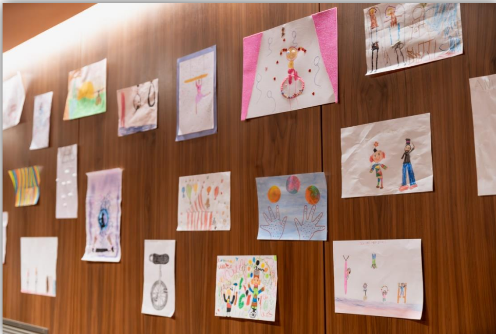
Kinder und Jugendliche gestalteten Kunstwerke zum Thema 'Ich im Zirkus'