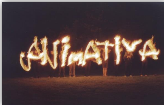
Animativa als Feuerlogo gestaltet von Jugendlichen des Vereins vor mehreren Jahren