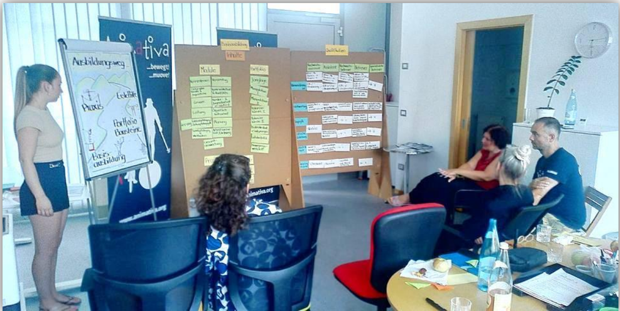
Klausurtagung 2023 – Überarbeitung des Ausbildungsweges im Verein

Der Vorstand des Vereins (letzte Vorstandswahl: März 2022) hat im Jahr 2023 elf Vorstandssitzungen und eine Klausurtagung abgehalten. Zudem gab es eine Vielzahl an Arbeitstreffen von Vorstandsmitgliedern mit den MitarbeiterInnen des Vereins zu verschiedenen Themen wie Buchhaltung und Finanzplanung, Planung der Basisausbildung, Mitarbeitergespräche und weitere. Ein Teil der Sitzungen wurde aufgrund der räumlichen Distanz der Vorstandsmitglieder online durchgeführt.